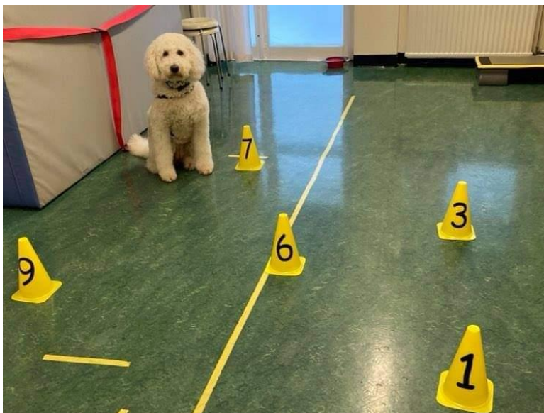
Redo för kluriga matteuppgifter!