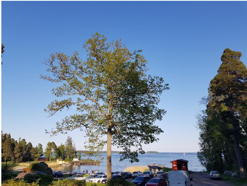
Brädvikens strandbad i "Bönan" norr om Gävle.