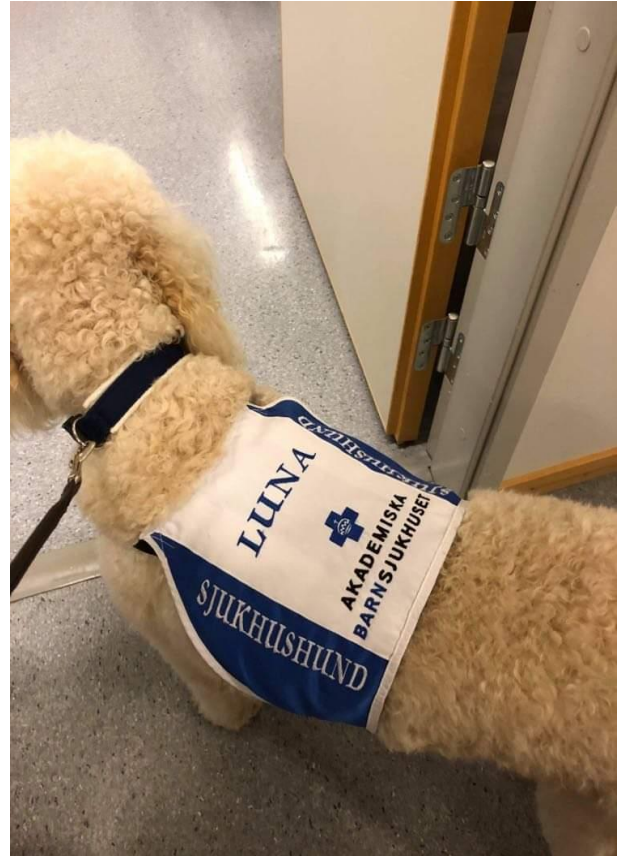
Luna har sina egna arbetskläder såklart!